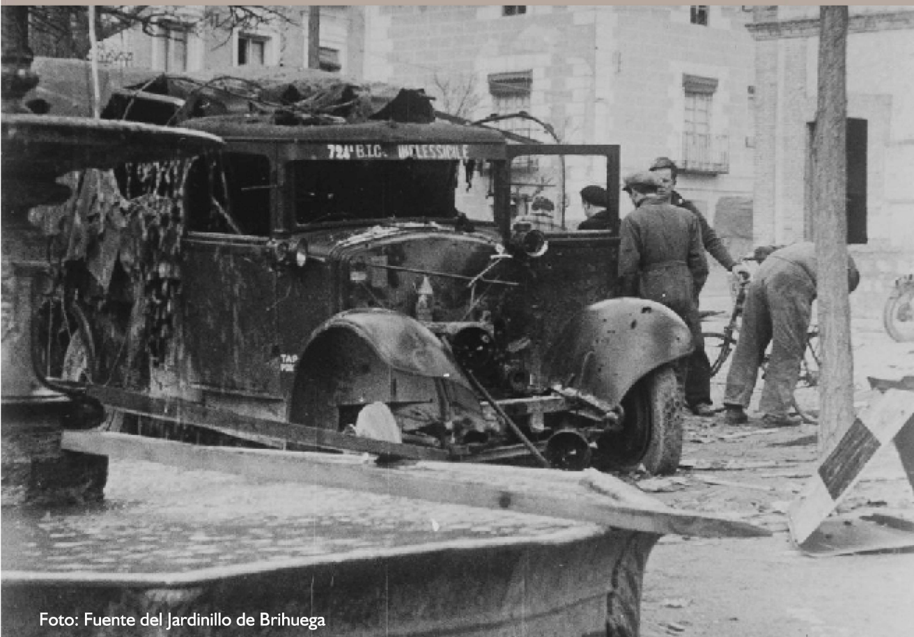
Foto: Fuente del Jardinillo de Brihuega